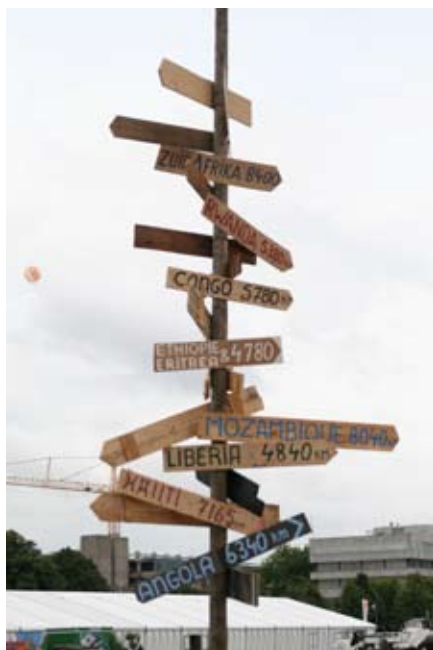
■ Bordjes verwijzen tijdens de Nederlandse Veteranendag naar de diverse missies in Afrika.

Ook vandaag de dag is onze Koninklijke Marine in Afrika actief en dan vooral in de wateren rondom Somalië, waar zij tracht de piraterij onder de duim te houden. Ook worden de Koninklijke Marine en de Koninklijke Luchtmacht ingezet bij het conflict om de macht in Libië. De toestand met de helikopterbemanning begin dit jaar zal niemand ontgaan zijn. De inzet van de F-16's mag