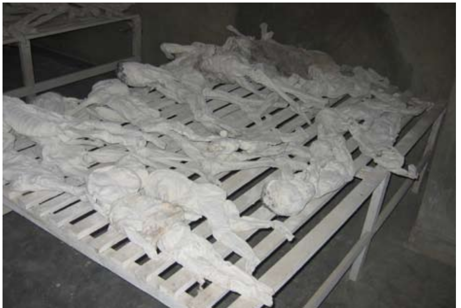
■ Een memorial van de massaslachting van de Tutsi's, waar overblijfselen liggen onder ongebluste kalk. Joost Gordijn bezocht de herdenkingsplekken in 2006.

Maar ik weet ook van een heel andere kant en dat is Afrikaanse kunst die voor mij een enorme zeggingskracht heeft. Ik was daar in 1994 al zeer van onder de indruk en ik heb sindsdien mijn collectie voortdurend uitgebreid."