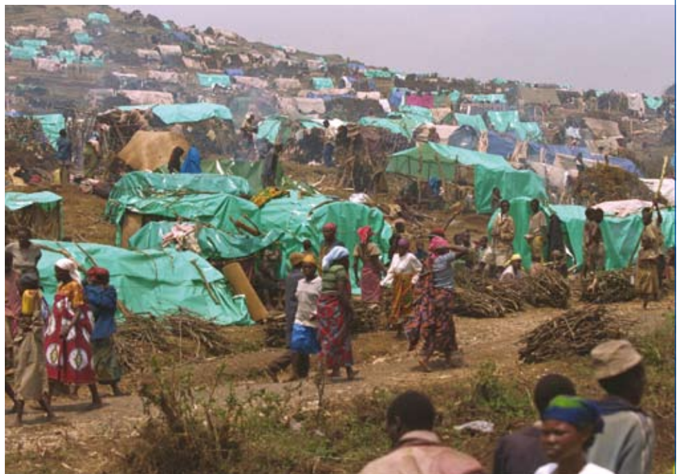
■ In de zomer van 1994 worden ruim honderd Nederlandse militairen ingezet in kampen voor Rwandese vluchtelingen.

zee vanuit Alexandrië te beschermen. De meest bijzondere rol voor een Nederlands schip op het continent van Afrika is waarschijnlijk weggelegd voor de Westernland . Dit tot troepentransport omgebouwde schip zou samen met de Nederlandse schepen Volendam en Pennland het gros van de vrije Franse troepen vervoeren die in 1940 zouden proberen Dakar, dat dreigde een U-boot -