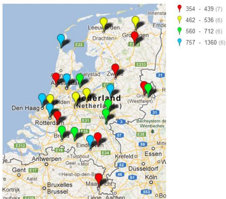
Figuur 3 Top 25 woonplaatsen van veteranen

Nast bovenstaand overzicht, hebben wij nog een mapje met de top 25 plaatsen gemaakt, eveneens gesorteerd op het aantal veteranen per woonplaats.